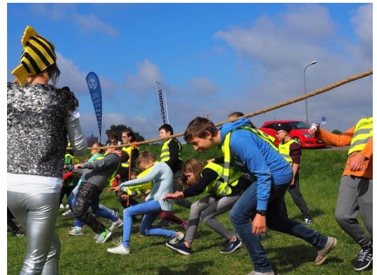
Grupowe zabawy z liną.